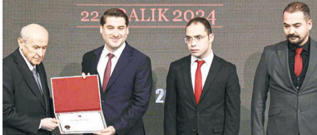
MHP Lideri Bahçeli, partisinin Siyaset ve Liderlik Okulu'nun 20. Dönemi'nde derece giren öğrencilere sertifikalarını takdim etti. Öğrenciler de Bahçeli'ye, Elif görseli ile sembolize edilen ve Fetih Suresi'nin ilk üç ayeti işlenen, üzerinde üç halilal de bulunduğu kaide hediye etti.

Bahçeli, "Kürtler kardeşimizdir. DEM Parti ise CHP'nin tahriklerine alet olmadan Türkiye partisi olma yönünde yürümektedir. İmralı ile sağlanacak görüşmeler sonucunda terörün bittiği, terör örgütünü lağvedildiği ortak gelecek ideali, insan ve millet sevgisi çerçevesinde açıklanmalıdır. Terör örgütü için sona gelmiştir. Türkiye ve Suriye kazanacak, emperyalizmin kaos planları kaybedecek" açıklamasını yaptı.