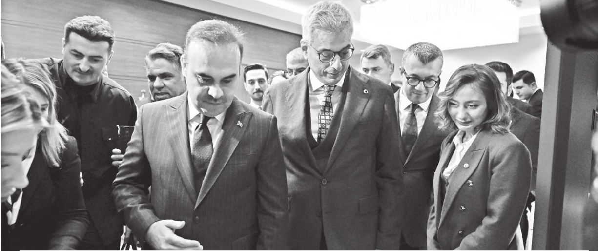
Sağlıklı Türkiye Yüzyılı "Üreten Sağlık" temalı tanıtım toplantısı Sağlık Bakanlığı Bilkent Yerleşkesi'nde gerçekleştirildi. Programın ardından Sağlık Bakanı Kemal Memişoğlu ve Sanayi ve Teknoloji Bakanı Mehmet Fatih Kacır, fuaye alanındaki stantları inceleyerek, yetkililerden bilgi aldı.

Sağlık Bakanı Memişoğlu, 'Üreten Sağlık Modeli'ni hayata geçirdiklerini belirterek, "Üniversitelerimizi ve özel sektörümüzü 3'lü sarmal modelimizle bir araya getiriyoruz. Sağlık çalışanlarımızı bu sürece güçlü şekilde dâhil ediyoruz" dedi.