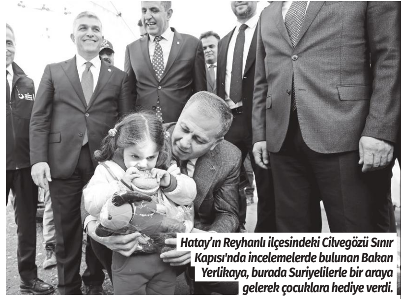
Hatay'ın Reyhanlı İlçesindeki Cilvegözü Sınır Kapısı'nda incelemelerde bulunan Bakan Yerlikaya, burada Suriyelilerle bir araya gelerek çocuklara hediye verdi.

Yerlikaya, Türkiye'de 2 milyon 888 bin 876 Suriyeli bulunduğunu belirterek, konuşmasını şöyle sürdürdü: Biliyorsunuz 2017'den beri Suriyeli kardeşlerimiz yıllardır ayrı kaldığı, özlem duyduğu, vatan hasreti çektiği topraklarına gönüllü, güvenli, onurlu ve düzenli bir şekilde geri dönüşlerini devam